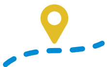
Ortung und Spurverfolgung

Durch die permanente Überwachung der Kühlkette wird es einfach möglich, Temperaturverläufe umfänglich und ohne Lücken zu dokumentieren, um so den Nachweis einer geschlossenen Kühlkette zu erbringen, insbesondere natürlich bei Lebensmittel-Transporten gemäß EN12830 oder Pharma-Transporten gemäß GDP. Alarmer bei Überschreitungen von Sollwerten ermöglichen frühzeitiges Handeln.